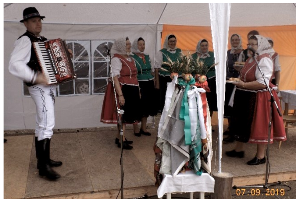
Pripravila: Agnesa Žifčáková

Je dobré, že aj takým spôsobom dáva do povedomia našu folklórnu skupinu.