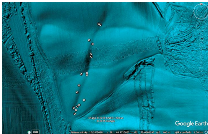
Obr.2: Výstup GPS zamerania získaných archeologických nálezov na podklade lidarovej mapy: zdroj LIDARu: Národné lesnícke centrum Zvolen