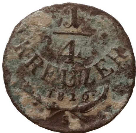
Obr.1: Medený ¼ grajciar z roku 1816

Furman-Soják 2008: Furman, Martin – Soják, Marián: Domaňovce vo svetle archeologických výskumov. In: Agnesa Žifčáková a kol. Z dejín Domaňoviec 1258 – 2008, Domaňovce 2008, s. 15-30.