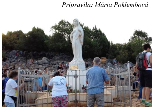
Pripravila: Mária Poklembová