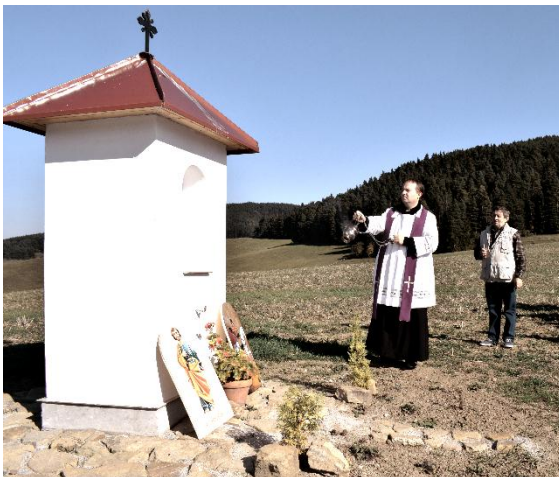
Pripravila: Mgr. Ivana Farkašová