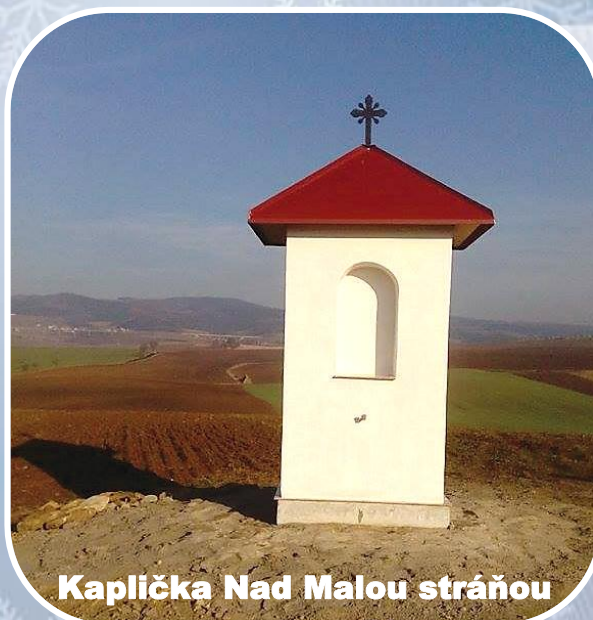
Kaplička Nad Malou stráňou