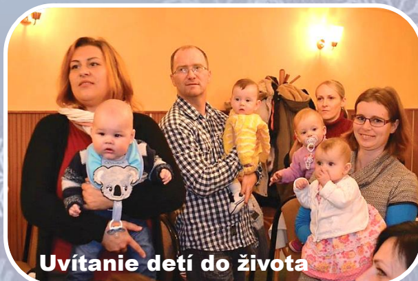
Uvítanie detí do života