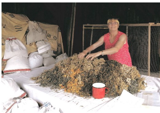
Pripravila: Mária Poklembová