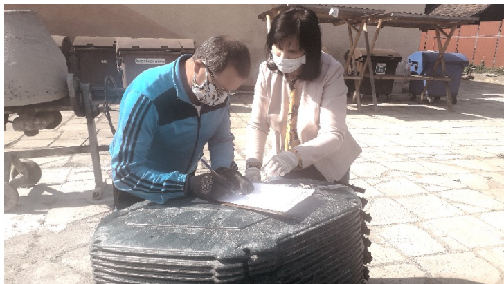
Pripravila: Mgr. Mária Chovancová

Kompostéry získali občania do prenájmu na dobu 5 rokov až po tejto dobe sa stáva ich vlastníctvom. Zverený majetok musí byť umiestnený na ich pozemku a občan je povinný chrániť kompostér pred jeho poškodením, zničením alebo odcudzením. Počas piatich rokov je povinný umožniť vykonanie kontroly zvereného majetku kontrolným orgánom. Občan je zároveň povinný nahlásiť každé jeho poškodenie, zničenie alebo odcudzenie. Občan nesmie kompostér predať alebo dať do vlastníctva tretej osobe.